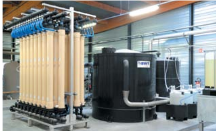
Installation d'ultrafiltration en prétraitement industriel avant osmose inverse